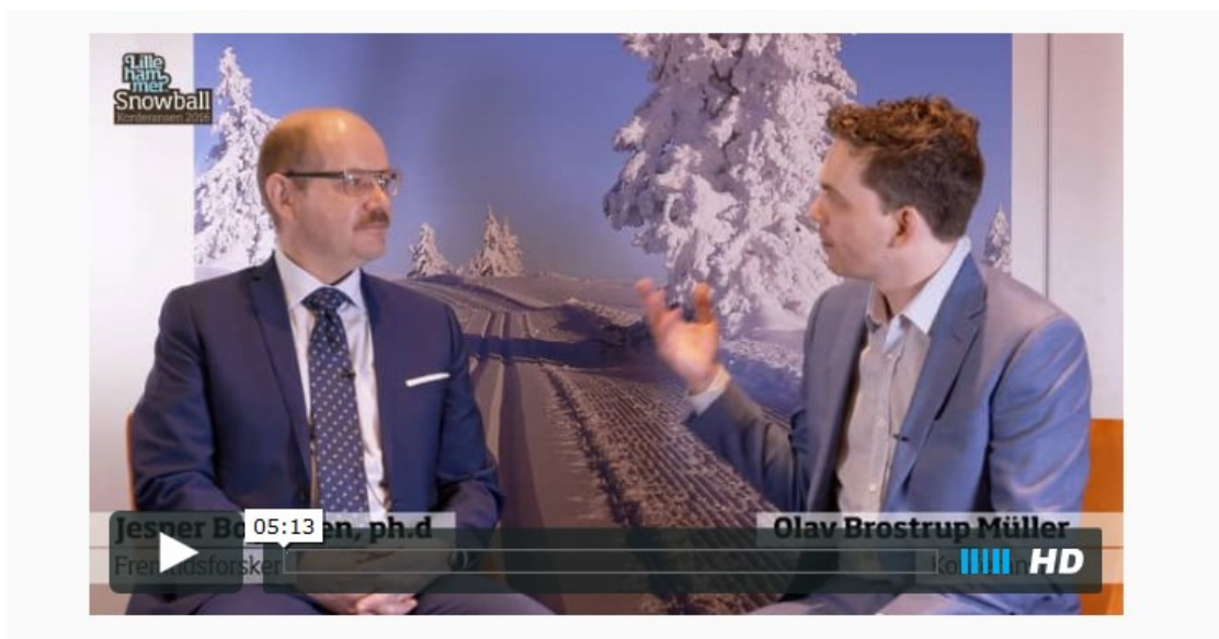
Intervju med foredragsholder, SB 2016

Konferansen har en ambisjon om å bidra til innovasjon og nyskaping innenfor sine områder med fokus på spredning/deling av ny kunnskap både før, under og etter konferansen. Det er derfor ønskelig å bruke digitale media (sosiale medier, videostreaming, intervju med foredragsholdere mm) som kan å bidra til større interaksjon og gjøre kunnskapen mer tilgjengelig. Dette tror vi også vil bedre konferanseopplevelsen som helhet og styrke konferansens merkevarebygging.